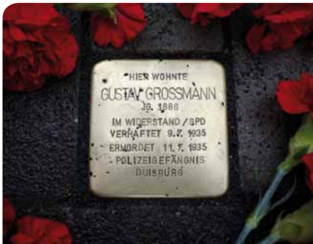
Stolpersteine – Verlegung am Donnerstag, 25. August, um 9.30 Uhr in der Mattheck und um 11 und 11.30 Uhr in Meerbeck, Weserstr. 19 und 29. Weitere Infos: www.stolpersteine-moers.de .

Betroffenengruppe von Parkinsonerkrankten , 10-12 Uhr, AWO-Begegnungsstätte-Fritz-Büttner-Haus, Bonifatiusstr. 72